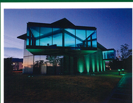
2023 久光製薬ミュージアム

投稿のハッシュタグ #グリーンライトアップ #グリーンリボンキャンペーン #グリーンリボンデー