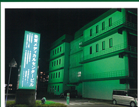
2023 佐賀メディカルセンタービル